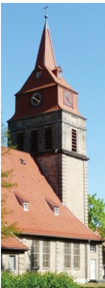
Taborkirche Berlin-Wilhelmshagen Schönblicker Straße S-Bahn Wilhelmshagen, Bus 161