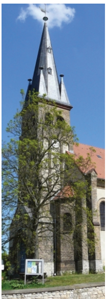
Dorfkirche Berlin-Rahnsdorf Dorfstraße Bus 161 (ca. 1000 m Fußweg)