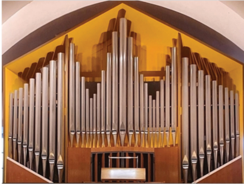
Schuke-Voigt-Orgel in der Taborkirche Wilhelmshagen | Foto: M. Weber

Konzerte mit der Schuke-Voigt-Orgel in der Taborkirche Wilhelmshagen